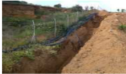
Obras de la red terciaria