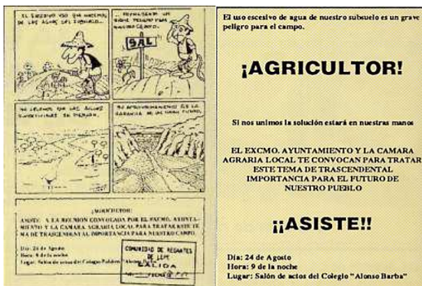
Primeros carteles de convocatoria de la 1ª asamblea

Para esa trascendental iniciativa se contó en todo momento con el respaldo municipal, de la Cámara Agraria Local y de un grupo de personas que vieron desde un primer momento la importancia de la propuesta y la bondad de la misma para mejorar las condiciones de vida de la familia agrícola.