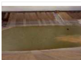
Balsa para riego