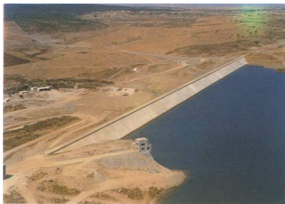
Presa del Piedras

Debido a que la Presa del Piedras se encontraba muy lejana de nuestras tierras de labor y que el Canal del Piedras tampoco las atravesaba se recurrió a la reivindicación de la construcción de la Presa de Los Machos cuya ubicación se iba a encontrar bastante cercana a nuestra superficie cultivable.