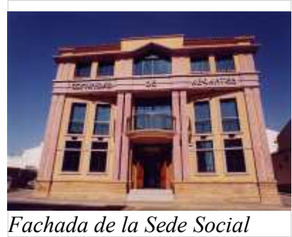
Fachada de la Sede Social

Con el referido fondo económico constituido a lo largo de cerca de veinte años y la ayuda de una subvención de la Asociación para el Desarrollo Rural Integral de la provincia de Huelva, la financiación del proyecto y la dirección de obras por parte de la Caja Rural del Sur y de la licencia de obras por parte del Ayuntamiento de Lepe, fue definitivamente posible contar con la soñada Sede Social para la Comunidad de Regantes, siendo inaugurada oficialmente en un acto solemne por el Sr. Ministro de Medio Ambiente, después de haber abierto sus puertas para el servicio a sus usuarios el 15 de diciembre de 2000.