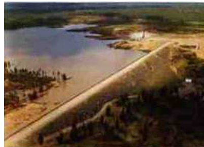
Presa de Los Machos

La Comunidad de Regantes de Lepe, codo con codo con el Ayuntamiento, logró en muy poco tiempo que la referida Presa de Los Machos se construyera por parte de Confederación Hidrográfica del Guadiana. Baste recordar para observar la prontitud del logro de la referida construcción el que la Comunidad de Regantes fue constituida en diciembre de 1984 y la presa fue inaugurada en mayo de 1988.