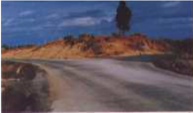
Camino de Castillejos y Las Majadillas