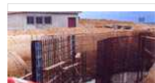
Estación de bombeo del Sector 8 en ejecución

En esta ingente tarea ha ocupado un lugar muy importante de nuestra actividad con respecto a las obras oficiales de la Zona Regable del Chanza, la ejecución por parte de nuestra entidad de las redes terciarias de riego (desde las casetas de agrupación hasta las parcelas de los agricultores) de los sectores 8, 9, 10, 11 y 12-13 Sur (más de 4.500 hectáreas). Para la realización de estas obras hemos conseguido para los agricultores una subvención del 40 % en los sectores 8, 9, 10 y 11 y en torno al 60 % para el 12-13 Sur (este incremento último ha sido debido a un cambio legislativo que así lo ha determinado). Estas obras han posibilitado la pronta puesta en cultivo de una importante superficie agrícola que si no la hubiésemos realizado con toda seguridad hubiese tardado muchísimo más tiempo en transformarse en regadío y por tanto no estar generando de forma casi inmediata trabajo y riqueza.