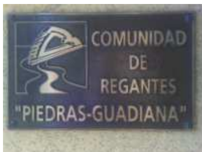
Placa de la C.R. Piedras-Guadiana

No obstante lo anteriormente dicho, al mismo tiempo de nuestra transformación de una comunidad de regantes local en una comarcal por la fuerza de los hechos y por la demanda de los agricultores de los pueblos vecinos, existían en la Redondela y en Ayamonte iniciativas tendentes a constituir comunidades de regantes locales en sus respectivos municipios.