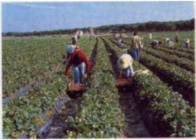
Cultivo de la fresa

A comienzos de la década de los setenta del recientemente pasado siglo, la situación general de la agricultura en la provincia de Huelva era de auténtica subsistencia y de abandono creciente por parte de la población agrícola más joven.