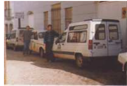
Personal de mantenimiento

Otra importante tarea de la Comunidad de Regantes con respecto a las obras de riego oficiales es su custodia y mantenimiento permanente. En cuanto las obras de los diferentes sectores de riego oficiales van siendo terminadas por la Administración competente son entregadas para su administración y servicio a la Comunidad de Regantes. Un equipo de técnicos y profesionales diversos de la Comunidad no solamente cuidan de que dichas instalaciones presten el servicio permanente de suministro de agua a todas y cada una de las parcelas de los agricultores sino que las mismas se encuentren en todo momento en perfecto estado de revista.