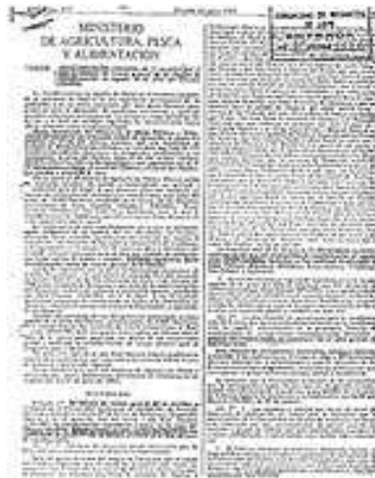
R.D. 1242/1985 por el que se declaraba de Interés General de la Nación la transformación en regadío de la Zona Regable del Chanza

nuestra parte desde un primer momento. Mientras que estas obras oficiales se han venido ejecutando hemos venido promoviendo las referidas “obras de riego en precario” con tal de que los agricultores se aprovecharan del buen momento agrícola.