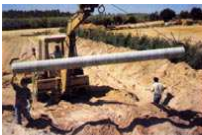
Obras de riego "en precario"

La Comunidad de Regantes de Lepe, codo con codo con el Ayuntamiento, logró en muy poco tiempo que la referida Presa de Los Machos se construyera por parte de Confederación Hidrográfica del Guadiana. Baste recordar para observar la prontitud del logro de la referida construcción el que la Comunidad de Regantes fue constituida en diciembre de 1984 y la presa fue inaugurada en mayo de 1988.