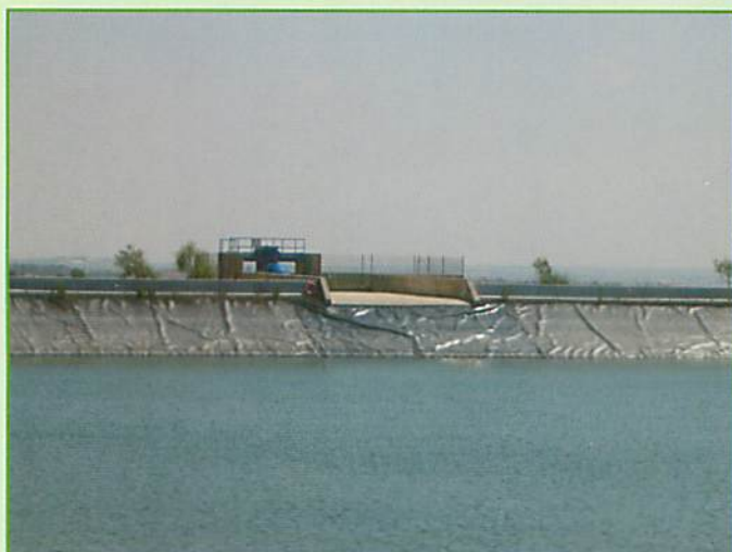
Cántara de Rebombero