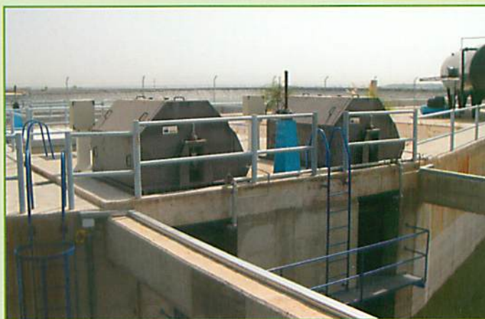
Filtros de Banda