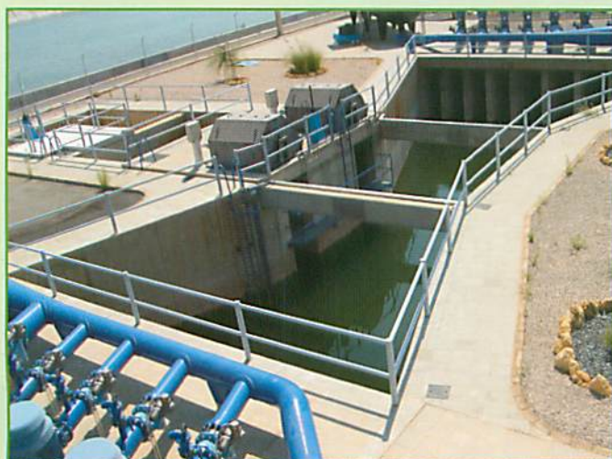
Cántara de Aspiración