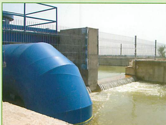
Llenado de Balsa