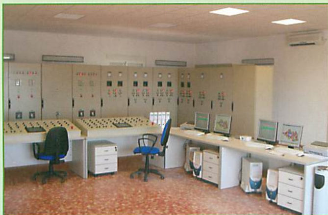
Sala de Control